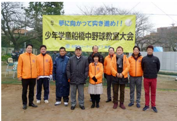
1月23日（日） 第8回船橋中野球教室大会