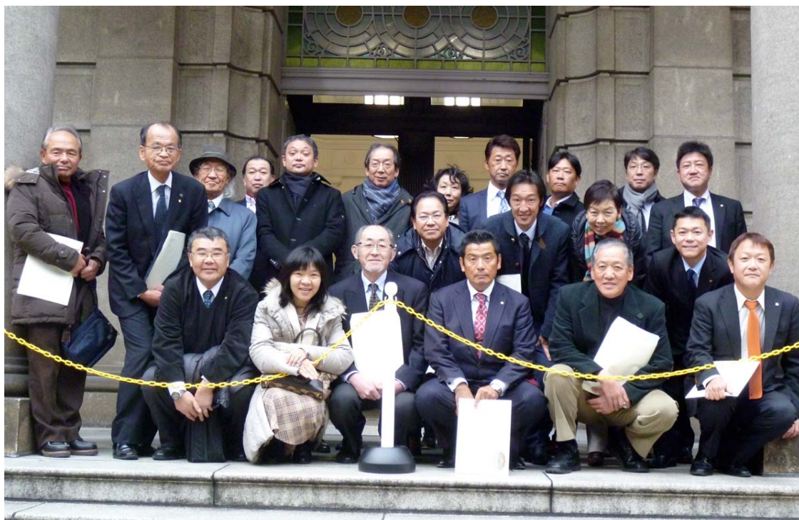
日本銀行本店（貨幣博物館）見学